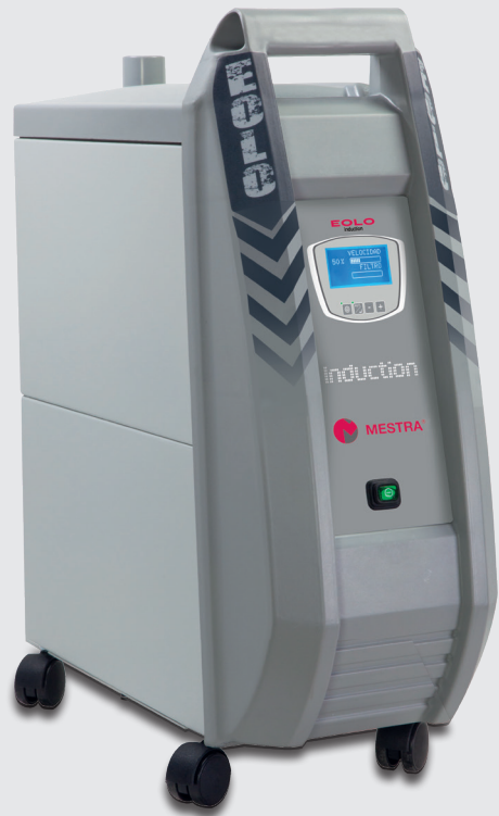
Unidad de aspiración Eolo Induction REF. 080533